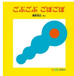
「 ゴボゴボ ゴボゴボ 」 駒形 克己 作