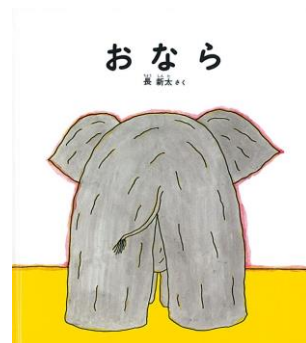
「 おなら 」 長 新太 作

「ぷーん」「ぷくぷくぷく」「ぷぷぷ」などの音(言葉)の響きやリズムの楽しさを、色あざやかなオレンジ、赤、青などの丸の動きで子どもたちに届けます。