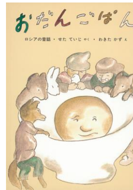
「 おだんごぼん 」 瀬田 貞二 訳 / 脇田 和 絵

だれでもおならをします。人間ばかりでなく、動物も。そうのおならはとても大きい！そして、そして肉食動物のおならは臭く、草食動物のおならはそんなに臭くない。この絵本では、どうしておならがでるのか、どのくらい出るのかなど、おならの秘密をユーモラスな絵とともに解き明かします。